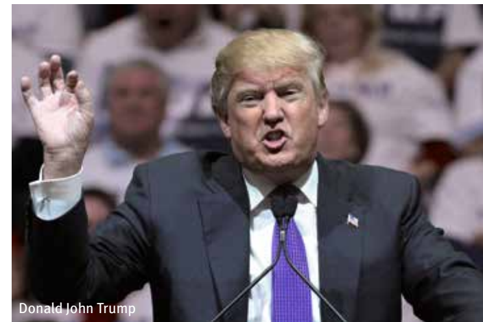
Donald John Trump

Trump slaat een heel andere toon aan. Ten eerste valt hij zijn tegenstanders persoonlijk aan. Zo noemde hij Marco Rubio een 'lichtgewicht' en een 'klein jongetje' (Trump, 2016a). Wanneer de term 'lichtgewicht' letterlijk wordt opgevat, heeft deze betrekking op het formaat en gewicht van Rubio. De term kan echter ook metaforisch worden opgevat en dan betekent