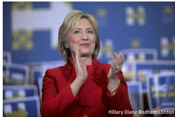
Hillary Diane Rodham Clinton